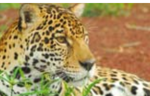
Felinos de América del Sur Paola Roots

10.00 MontPhoto. Mónica Busquets y Paco Membrives hablarán sobre las Imágenes que ganan concursos . Una aproximación a los elementos que hacen que una fotografía nos seduzca. Tendemos a pensar que los criterios de valoración de una imagen dependen de las preferencias del observador. Pero la realidad pone de manifiesto que una misma fotografía es premiada en distintas competiciones, con jurados y procesos de veredicto muy dispares. ¿Qué tienen de especial estas fotografías?