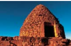
Naturaleza y situación antrópica Ernest Costa i Savoia

11.30 Paola Rodríguez: Felinos de América del Sur y conflictos que presenta su relación con el ser humano . En Suramérica se reporta la presencia de diez especies de felinos de las 37 que se conocen en el mundo. Estos animales nos encantan por la belleza y mística que los envuelve; paradójicamente, una de sus principales amenazas son los conflictos con el hombre y la mayoría de estas especies se encuentran en altas categorías de extinción.