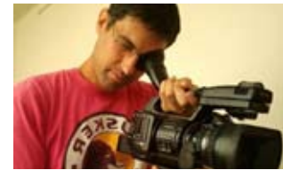
De la foto al documental