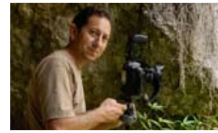
Serranía de Cuenca José Larrosa

16.00 Acróbatas y otras historias: como nace un proyecto fotográfico. Ugo Mellone hablará de proyectos desarrollados en varios ambientes, desde el Sahara hasta la Patagonia. Y presentará "Acróbatas", un libro dedicado a la cabra montés tras tres años de duro trabajo.